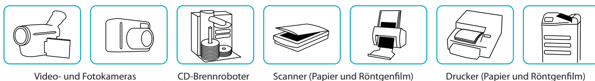
Video- und Fotokameras